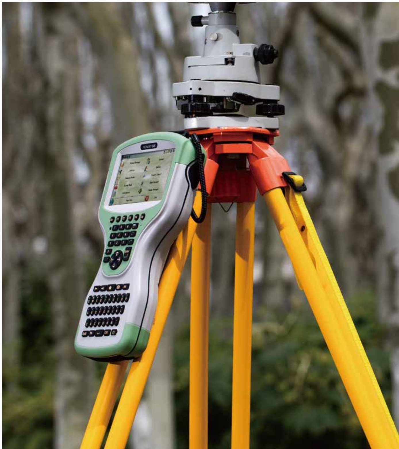
T21系列坚固型QWERTY全键盘手持设备